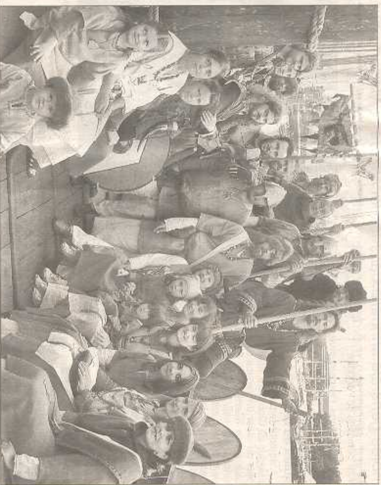
Ces troupes Vikings qui étaient sur le Dreknor seront à Barfleur dimanche prochain.

L'équipage était constitué des bénévoles qui avaient perdu de mener à bien le projet. C'est fatigués mais heureux qu'ils ont vécu les premiers pas de leur gros bébé. A Rouen les journées ont été longues, très longues. Des portions-miner c'était réveil façon chants des marins du bateau mexicain qui faisaient leur footing bien avant l'envol des couleurs. Le dernier soir, le samedi, alors que toutes les autres bateaux avaient fermé, les écoutes à 19h00, le drakkar